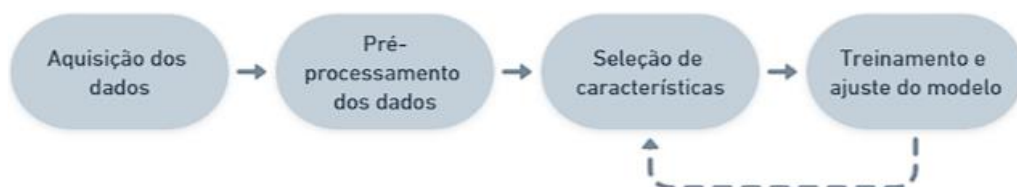
Figura 1 - Metodologia aplicada no trabalho

O presente estudo seguiu a metodologia de trabalho descrita na Figura 1. Como fonte de dados, foram utilizados a base de dados da PHM society conference data challenge 2010 , que fornece dados reais de fresadoras com controle numérico computadorizado (do inglês, Computer Numeric Control - CNC ) de alta velocidade. A aquisição de dados coletou informações de dinamômetro, acelerômetro e captador de emissão acústica. Esses sensores estão presentes na Figura 2. Os dados são de três máquinas fresadoras CNC, compostos de cerca de 300 arquivos com 8 colunas cada, sendo uma delas o nível de degradação do equipamento medido em laboratório.