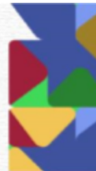
Rendimento Acadêmico x Frequência na Monitoria