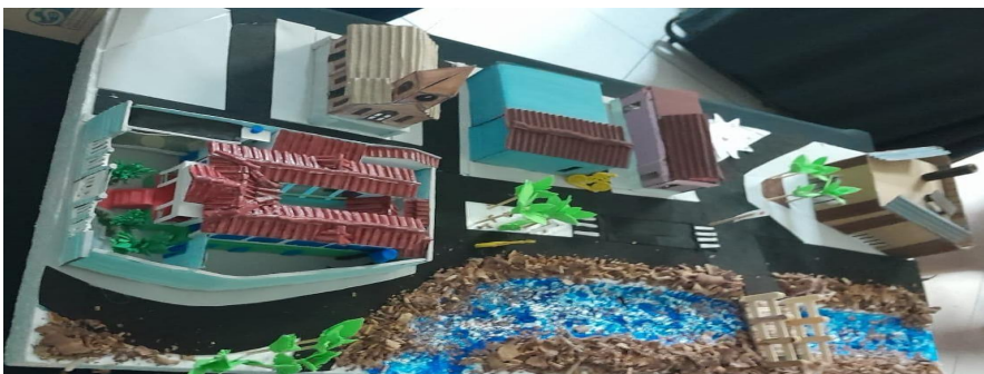
Figura 1. Maquete Rio Salinas, Mercado Municipal, Igreja e E.M. João Porfírio. Fonte: Autores (2023)

2- Você conhecia os conceitos das categorias dentro da paisagem?