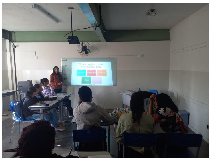
Figura 2. Proposta de quiz com os alunos 1ª ano 03, com o tema de característica dos diferentes ecossistemas. 10 DE JULHO DE 2023.