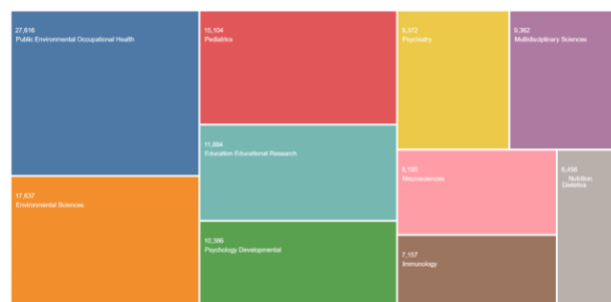
Figura 1. Relação das áreas que mais publicam sobre a temática criança e natureza. Equação de busca: “(((ALL=( child ) OR ALL=( childhood )) OR ALL=( children )) AND ALL=( nature OR environment or natural environment ))”

PROFICE, Christiana. As crianças e a natureza: reconectar é preciso. 1 ed. São Paulo: 2016.